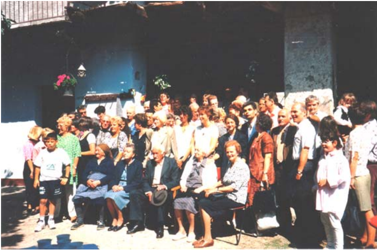
La festa dei Cardoli a Rovigo. Il gruppo é reunito davanti alla masseria nel settembre 1995