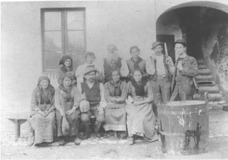
I Cardoli a Rovigo - 1900